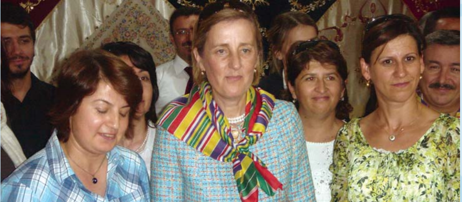
2009 Yılında Kadın ve Aileden sorumlu Devlet Bakanımız Sayın Selma Aliye KAVAF