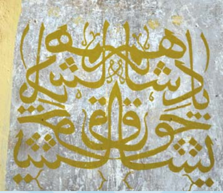
“Padişahım Çok Yaşa”