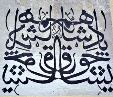
“Padişahım Çok Yaşa”