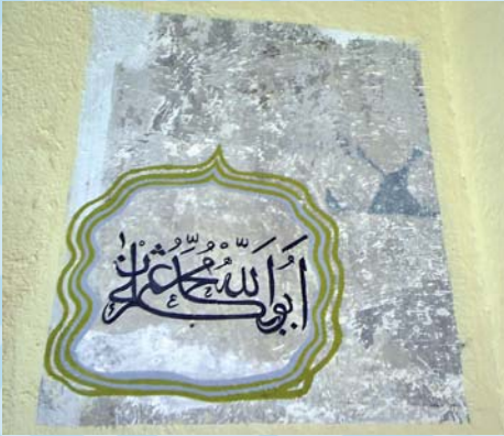
“Allah, Muhammed, Ebubekir, Ömer, Osman, Ali”